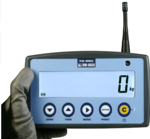
Ripetitori di peso in radiofrequenza per indicatori serie DFW e dinamometri serie MCW.