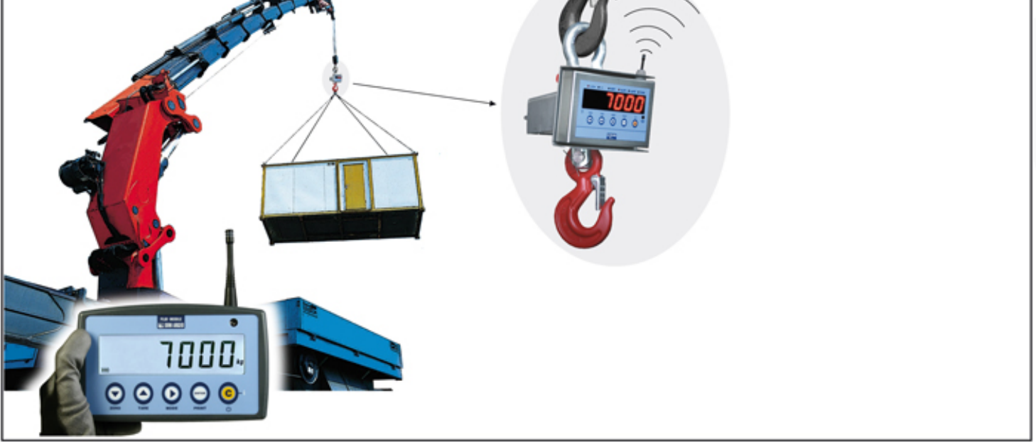
Applicazione ripetitore monobilancia.