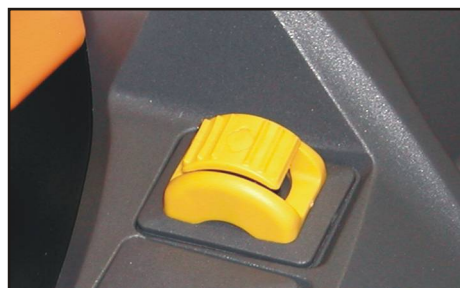
Roller per il controllo della velocità di discesa delle forche