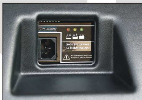
Caricabatterie incorporato alta frequenza con indicatore di carica batteria e blocco forche