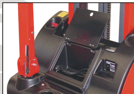
Portaoggetti completo di portello di chiusura