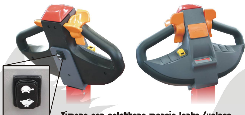
Timone con selettore marcia lenta/veloce