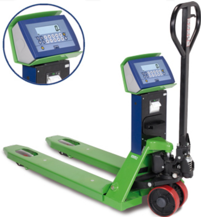
Transpallet pesatore TPWP con stampante opzionale

Transpallet con pesatura elettronica integrata ad altissime prestazioni. Il rilevamento del peso tramite 4 celle di carico garantisce la massima precisione. Affidabili, adatti anche per condizioni gravose di lavoro, sono indispensabili dove occorre pesare con precisione qualsiasi tipo di prodotto su pallet. Disponibili anche in versione OMOLOGATA CE-M